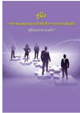
หนังสือ สมรรถนะหลัก