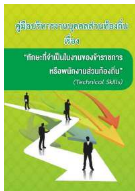
หนังสือ ทักษะที่จำเป็นในงานของข้าราชการ หรือพนักงานส่วนท้องถิ่น