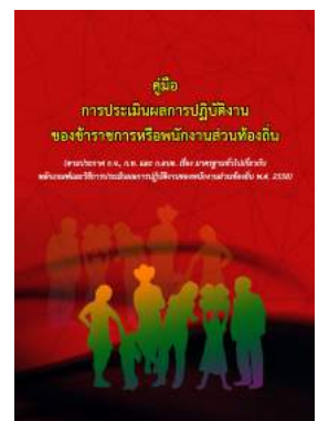
หนังสือ การประเมินผลการปฏิบัติงาน ของข้าราชการหรือพนักงานส่วนท้องถิ่น