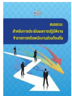
หนังสือ สมรรถนะสำหรับการประเมินผลการปฏิบัติงาน ข้าราชการหรือพนักงานส่วนท้องถิ่น