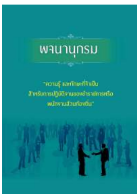
หนังสือ ความรู้ และทักษะที่จำเป็น สำหรับการปฏิบัติ งานของข้าราชการหรือพนักงานส่วนท้องถิ่น