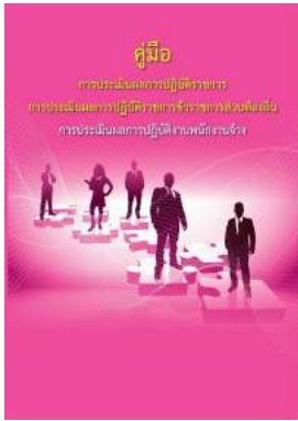
หนังสือ การประเมินผลการปฏิบัติงานพนักงานจ้าง