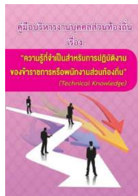
หนังสือ ความรู้ที่จำเป็นสำหรับการปฏิบัติงาน ของข้าราชการหรือพนักงานส่วนท้องถิ่น