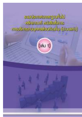
หนังสือ รวมประกาศมาตรฐานทั่วไป หลักเกณฑ์ หนังสือสั่งการ การบริหารงานบุคคลส่วนท้องถิ่น