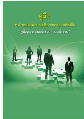
หนังสือ สมรรถนะประจำตำแหน่งงาน