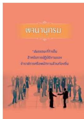
หนังสือ สมรรถนะที่จำเป็นสำหรับการปฏิบัติงานของ ข้าราชการหรือพนักงานส่วนท้องถิ่น