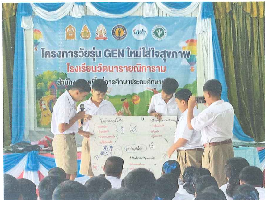
กิจกรรมถอดบทเรียนสรุปองค์ความรู้จากการอบรมเชิงปฏิบัติการเยาวชนรุ่นใหม่ใส่ใจสุขภาพในสถานศึกษา