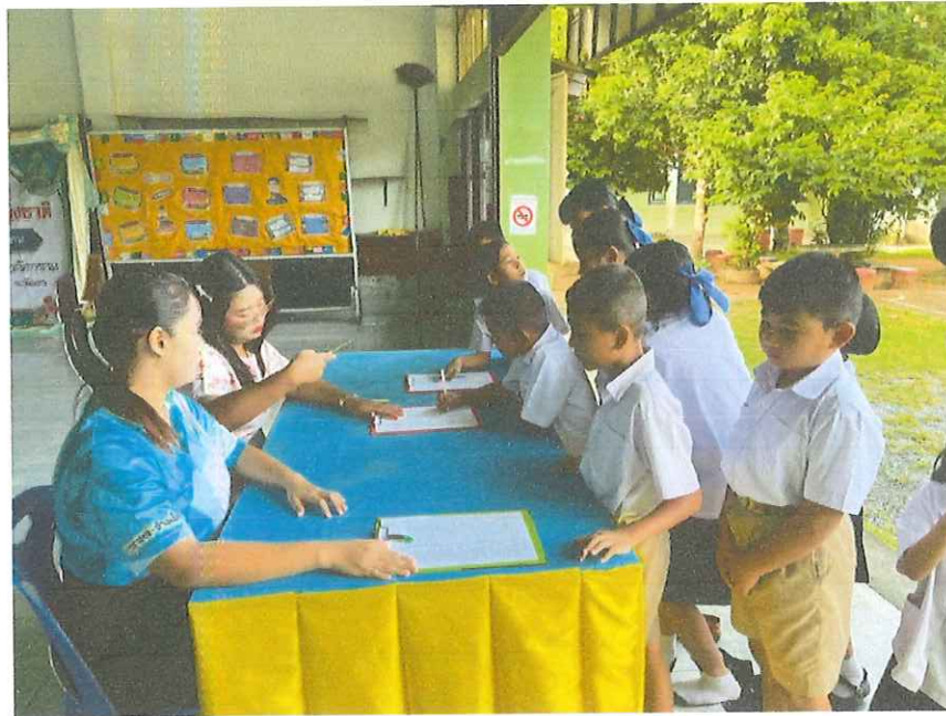
นักเรียนชั้นอนุบาลปีที่ 2-ประถมศึกษาปีที่ 3 ลงทะเบียนเข้าร่วมโครงการวัยรุ่น Gen ใหม่ใส่ใจสุขภาพ ในวันศุกร์ที่ 12 กันยายน พ.ศ..2568 ณ หอประชุมโรงเรียนวัดนารายณ์การาม