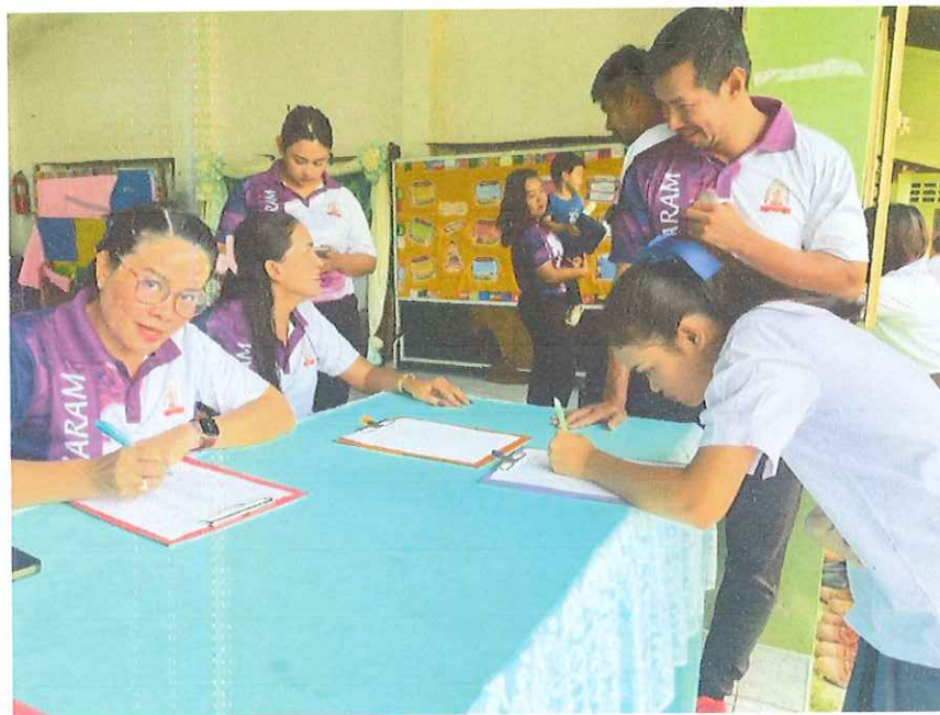
นักเรียนชั้นประถมศึกษาปีที่ 4-มัธยมศึกษาปีที่ 3 ลงทะเบียนเข้าร่วมโครงการวัยรุ่น Gen ใหม่ใส่ใจสุขภาพ ในวันเสาร์ที่ 13 กันยายน พ.ศ..2568 ณ หอประชุมโรงเรียนวัดนารายณ์การาม